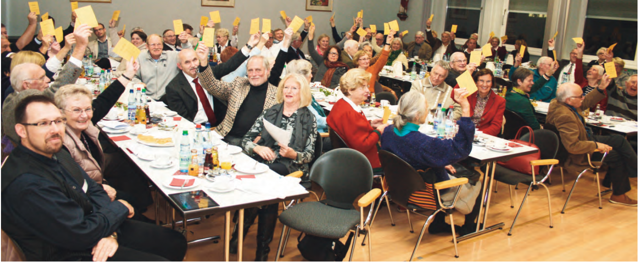
Zweimal jährlich hält der Förderverein eine Mitgliederversammlung ab.